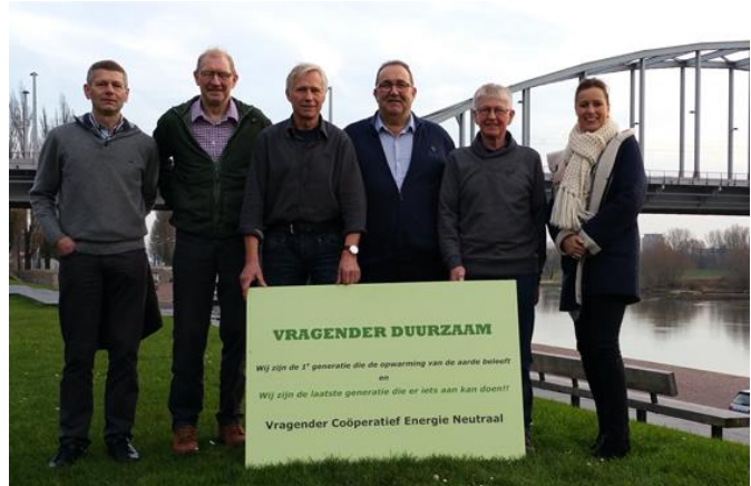
Het team dat de subsidie Gelderse Maten heeft verzorgd.

De coöperatie VCEN nodigt u uit om te participeren in de coöperatie die zonnepanelen op het collectieve zonnedak gaat plaatsen. U wordt dan mede-eigenaar van deze zonnepanelen.