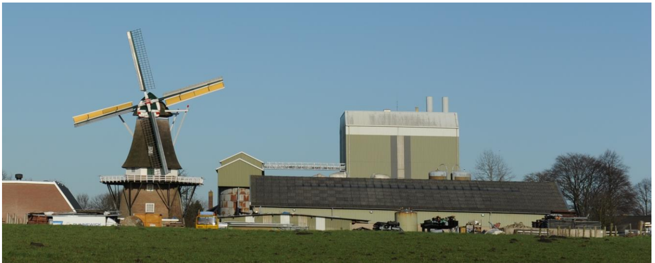
Het beoogde dak waar de zonnepanelen komen te liggen: Gunnewick Mengvoeders in Vragender

Naast het positieve bijdrage die u hiermee aan het milieu levert, levert het u persoonlijk ook een financieel rendement op. Deze brochure geeft u antwoord op de vraag hoe dat mogelijk is.